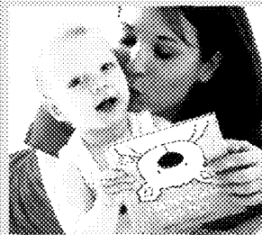
TIPS (3) CORBIS

tanti disegni divertenti da scaricare e riportare sulle magliette dei bebè (però serve la speciale carta "iron on transfer"). Dall'area community di www.fissan.com , invece, si ha la possibilità di consultare on line pediatri e dermatologi che danno consulenze gratuite via mail. In più, tante schede utili con il baby massage e i giochi per stimolare i suoi cinque sensi.